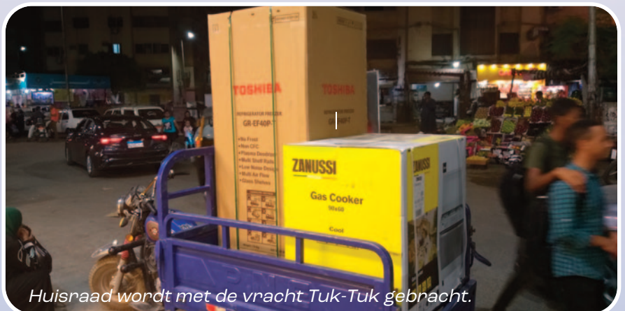
Huisraad wordt met de vracht Tuk-Tuk gebracht.

Nadat we 2 weken in het guesthouse verbleven, kregen we het aanbod om tijdelijk in het huis van een Amerikaans echtpaar, dat 3 maanden op verlof is, te gaan wonen. Het is een prachtige woning met een balkon aan de achterzijde, direct aan de Nijl. We hebben een prachtig uitzicht. Hier genieten we vooral 's morgens vroeg van als de zon opkomt rond 6:00 uur. Later op de dag is het te warm om buiten te zijn. We zijn kort na aankomst op zoek gegaan naar een