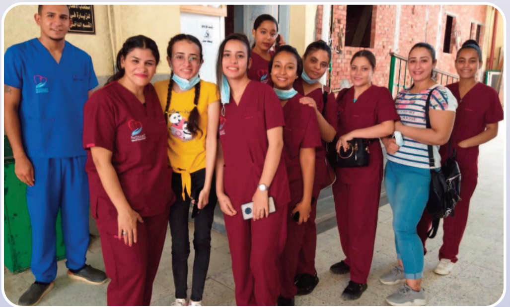
De groep enthousiaste leerling-verpleegkundigen.

Daarom kreeg Sijda al snel na aankomst de vraag van de ziekenhuisdirecteur en de manager om een opleiding voor verpleegkundigen te starten. Omdat de leerling-verpleegkundigen al waren aangenomen moest de cursus al op 1 juli starten. Dat was best snel en na goed overleg is besloten om een korte training "basis verpleegkunde" op te zetten. Deze training wordt gedurende 6 maanden gegeven. Twee weken theorie en daarna 4 weken praktijkstage. Deze cyclus zal zich nog 5 x herhalen voordat deze leerling-verpleegkundigen in januari/februari een toets moeten afleggen waarna zij bij een